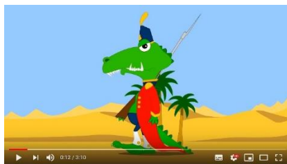
Ah les crocodiles

(musique bien arrangée mais...dessins médiocres)