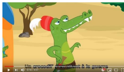
Ah les crocodiles comptine - 'Un crocodile' chanson avec paroles

(dessins plus doux mais... musique moins bien arrangée)