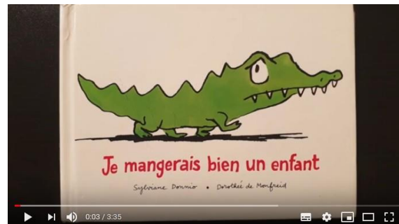
Lisons l'histoire de Je mangerais bien un enfant

https://www.youtube.com/watch?v=QXcxiBm0Ads