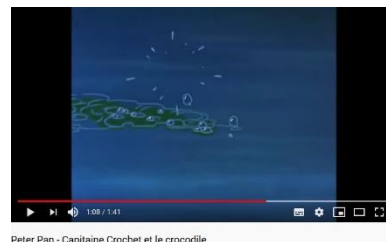
Peter Pan - Capitaine Crochet et le crocodile

https://www.youtube.com/watch?v=9gRB-IAj_yg