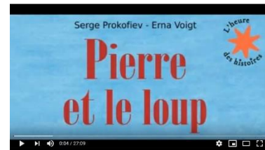
Pierre et le loup raconté aux enfants en images

Cette version est meilleure du point de vue de l'illustration que celle de Gérard Philippe (image figée). Ici, on voit quelques illustrations et les instruments de musique sont présentés au début de l'histoire.