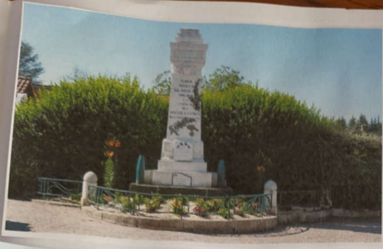
Monuments aux morts