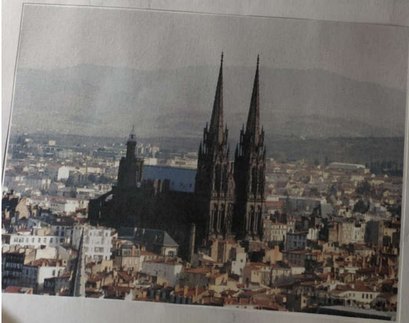
Cathédrale de Clermont - Ferrand