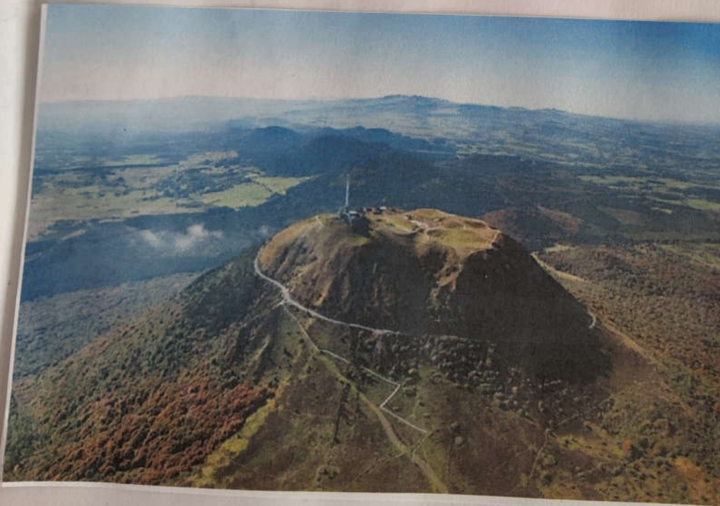
Peuy - de - dôme