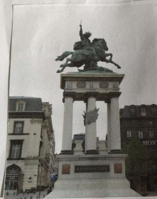
Statue de Vercingétorix