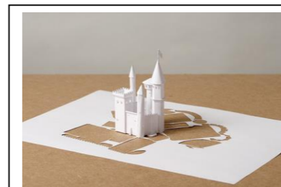
Peter CALLESEN, Château impénétrable , 2005, feuille A4, colle, Collection privée

Comprendre : Goldsworthy trie soigneusement les feuilles par couleur pour créer un dégradé du jaune vers le rouge. La disposition autour du trou crée un cercle vide et transforme les feuilles en élément lumineux. Il joue avec la nature pour dessiner avec. Une fois l'œuvre photographiée le temps détruira l'œuvre. Seule la photographie permet d'en garder une trace.