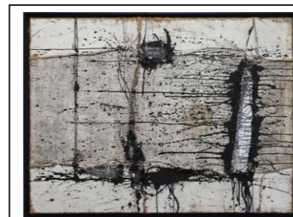
Manuel Millares, Cadre image , 1957, technique mixte sur toile de jute, 98 x 130 cm, Musée National d'Art Reina Sofia, Madrid

Comprendre : Cette projection théâtrale est une mise en scène qui raconte l'histoire de créatures étranges comme sorties de notre esprit. L'artiste joue avec l'espace et intègre le spectateur dans un conte de rêve ou de cauchemar.