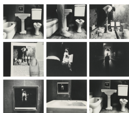
Duane MICHALS (1932 USA) , « Thing are queer » (les choses sont étranges), séquence photographique, 1973.