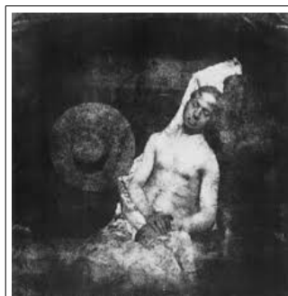
Hippolyte BAYARD (1801/1887) , 1840, positif direct sur papier. Mise en scène pour prouver que la photographie n'est pas un simple outil d'enregistrement du réel