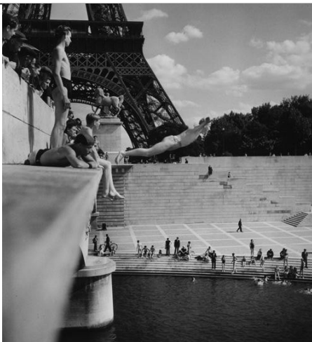
Robert Doisneau Le plongeur du Pont d'Iéna . 1945.

Dans le prolongement de la frondaison des arbres du fond, le corps du plongeur attire aussi le regard par le contraste entre chairs claires et arrière-plan sombre.